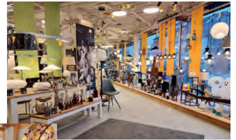
Bild oben und links: Lampen Kaiser hält nicht nur ein breites Sortiment an verschiedensten Leuchtsystemen vor, sondern berät Kunden auch mittels individueller Lichtplanung.

Unter Beibehaltung des Firmennamens führen Bhuiyan und drei Mitarbeiter das traditionsreiche Unternehmen nun in die weitere Zukunft. Im Zuge der Übernahme erfolgten Renovierungs- und Modernisierungsmaßnahmen im Ladenlokal, auch die