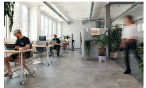
Bild oben: Neben Präsenzen an Hochschulen ist die SIKB auch in den Coworkingspaces FASE, Halle 4 und co:hub66 persönlich vor Ort – dort, wo Gründungsprojekte ihren Anfang nehmen.

Wie wichtig der verantwortungsvolle Einsatz der SIKB für Land und Leute ist, lässt sich auch an konkreten Zahlen ablesen: In den fünf Jahren von 2016 bis 2020 hat sie zur Gründungs- und Wachstumsfinanzierung ein zinsverbilligtes Kreditvolumen in Höhe von 507 Mio. Euro bewilligt und die saarländische Wirtschaft damit bei Investitionsvorhaben und Betriebsmittelbedarf unterstützt. Dies schuf bei den Unternehmen Anreize für eine Investitionstätigkeit von 761 Mio. Euro. Neben den Impulsen auf das saarländische Unternehmertum wirkt dies auch positiv auf