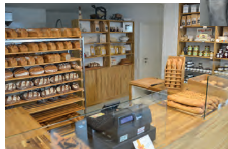
Bild oben und links: Mittels Handarbeit und regionaler Zutaten werden Backwaren in der gläsernen Backstube nach klassischer Tradition hergestellt.