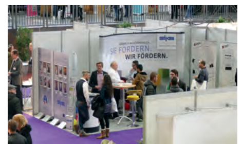
Bild oben: Niederschwellig für Unternehmen erreichbar zu sein, ist der SIKB sehr wichtig – zum Beispiel im Rahmen von Vorträgen oder Veranstaltungen, wie der saarländischen Gründermesse.

An der Hochschule für Technik und Wirtschaft des Saarlandes (htw saar) ist die FITT gGmbH als Institut für Wissens- und Technologietransfer Partner für Gründungsinteressierte und Startups. Auch hier besteht eine